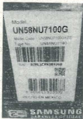
FOTO REFERENCIAL TAG Y PÓLIZA DE GARANTIA DE LOS OTROS PRODUCTOS:

Los Participantes residentes en los departamentos de Beni y Pando únicamente podrán registrar el producto a través del punto de canje digital.